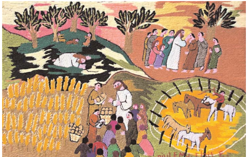
Dieses Plakat aus Chile weist rund um den Globus auf den Weltgebetstag hin.

In Leutkirch lädt das Vorbereitungsteam zum ökumenischen Weltgebetstag in diesem Jahr in die Dreifaltigkeitskirche ein. Der Gottesdienst beginnt am Freitag, 4. März um 19 Uhr. Im anschließenden gemütlichen Teil wird es neben Speis und